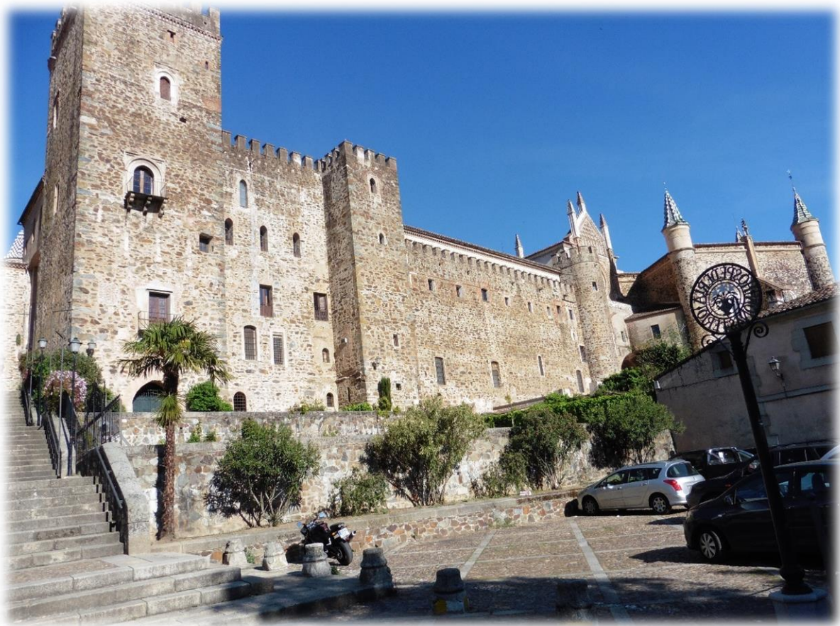
Het Real Monasterio de Santa María de Guadalupe is sinds 1993 werelderfgoed. Het klooster is één van de belangrijkste heiligdommen in Spanje samen met Santiago de Compostela en