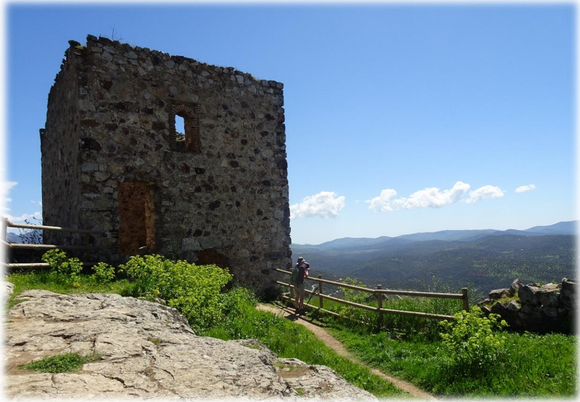
Helemaal boven in het dorpje staan nog enkele ruïnes van een eeuwenoud kasteel uit de twaalfde eeuw.