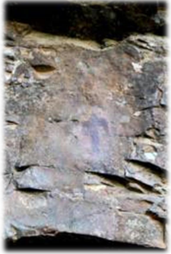
Op onze wandeling komen we al vlug aan de Cueva Chiquita. De grottekeningen in de Cueva