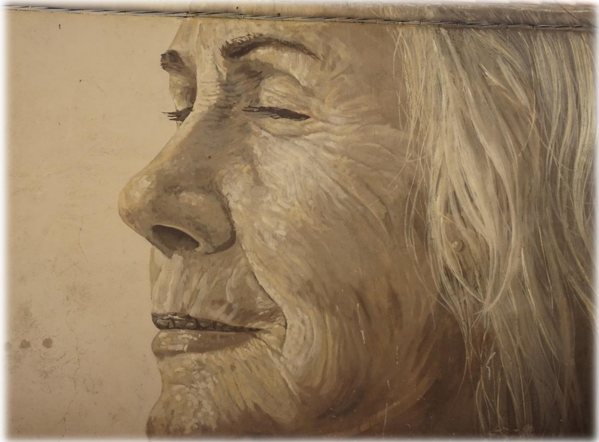
Op een van de woningen in het dorp treffen we een prachtige muurschildering aan van een plaatselijke artieste.