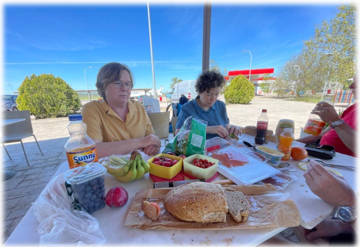
Voor we naar onze volgende bestemming rijden eten we onze picknick, langsheen een snelwegparking.